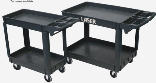
Laser Part No. 8089 Workshop Utility Cart Overall dimensions: 1030 x 430 x 835mm