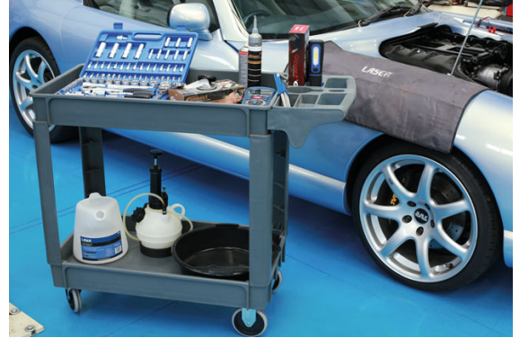
Laser Part No. 8090 Large Workshop Utility Cart Overall dimensions: 1190 x 645 x 835mm